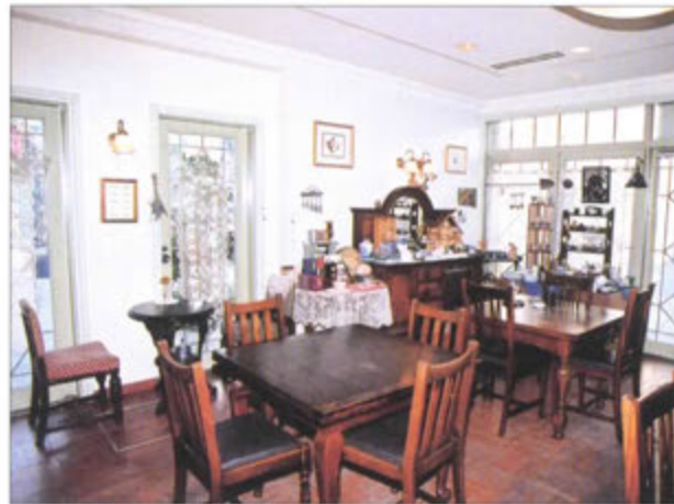
まちづくり相談室

上土町・緑町・縄手は、まちづくりを進めるなか、老朽化して解体を迫られる建物を、この街なみにはなくてはならないものとして曳家移転を行い、お城下町地区の街なみ環境整備事業のまちづくり拠点施設として保存再生されました。