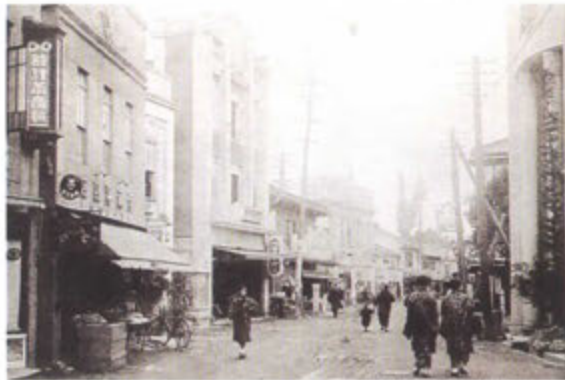
昭和初期の上土通り